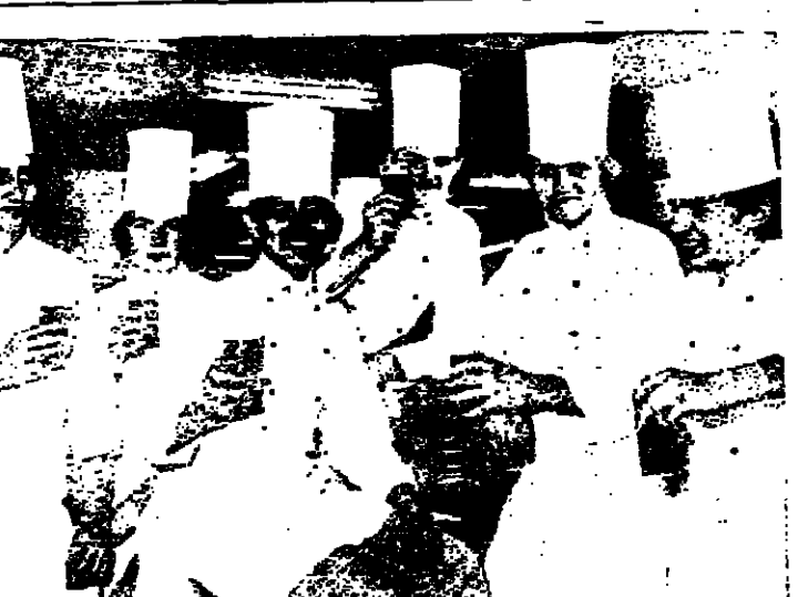
المانيا الاتحادية تبرز نسي سن الطوبو

كان يقال ان السروري مريض لان الغداء ممنوع بكرة الاغذية وخاصة الغداء الفاخر المركب من حلويات وما شبهها . لكن الواقع نقل ان هذا المرض انتشر ايضا لدى الشعوب الفقيرة المحتجة الى الاغذية - الفنية - واقبل الظن ان مرض السروري كان شائما لدى الفقراء ايضا ، وانما لم يكن معروفا لان الفقير قلما يستطيع دفع الاجور الطبية والتحاليل اللازمة لتخيص المرض . ويستل من تحقيقات منظمة الصحة العالمية ان السمنة الناتجة عن الارطاب في الاغذية هي سبب من اسباب السروري ولكن سوء التغذية هو ايضا سبب . ولا شك ان الارطاب في المواد السكرية يسبب اضطرابات جسدية لان مادة انسولين التي تفرزها غدة البنكرياس تعجز عن تدعيم من همم هذا السكر الزائد نسي المدم . غير ان السكر مادة اساسية للبدن .. وإذا كان النظام الغذائي لا يشمل على الكمية كافية من المواد السكرية كالتفواكه بنوع خاص فان الصلابة بالمرض السروري تصل ايضا .. تقصان السكر في الدم .